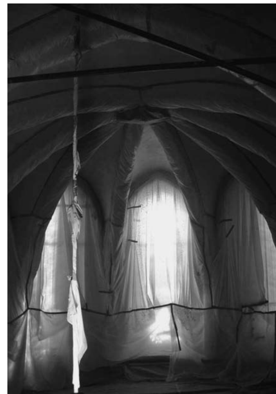
Confinement du chœur avant pose du nouveau revêtement acoustique