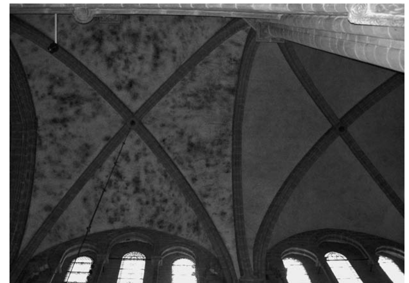
Une zone à restaurer

Les travaux de désamiantage démarrent au début du mois de mai. Ils sont menés à bien dans des conditions difficiles par des ouvriers en combinaison étanche qui travaillent en se relayant toutes les deux heures. Tous les déchets sont recueillis dans des sacs étanches puis évacués en vue d'une destruction sous contrôle. Les opérations de désamiantage sont terminées début juillet.