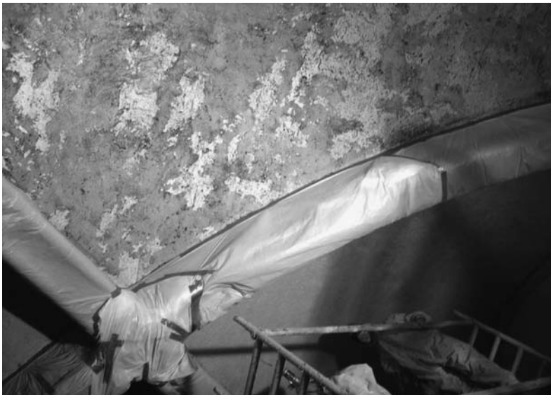
Bas : voûtain avec nouveau revêtement (1 re couche)

L'entreprise BBZ AG a été mandatée pour cette dernière étape et le produit retenu est posé en deux étapes :